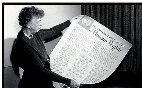
Declaració Universal dels Drets Humans de 1948

Pla Estratègic: http://www.dretsdels pobles.org/ca/qui-som/transparencia/pla-estrategic.html