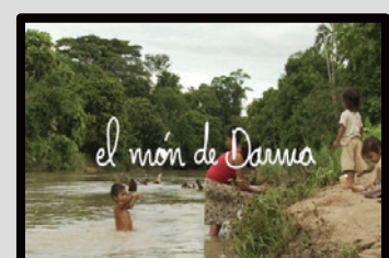
“El món de Darma”