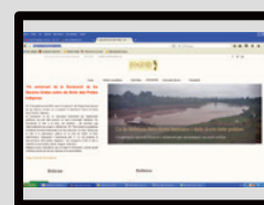
indigenes.dretsdelpobles.org Pàgina de la campanya de Pobles Indígenes

A part dels webs, les activitats de la Lliga i de les seves campanyes s'han difós molt a través de Facebook i Twitter. Actualment estan actius els comptes de Facebook de la Lliga dels Drets dels Pobles, i de les campanyes “Txetxènia, trenquem el silenci”, “Indígenes, quan la terra camina” i “Congo, perill de riqueses”. També comptem amb compte de Twitter de la Lliga (@LligaDP).