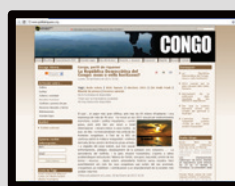
perillderiqueses.dretsdelpobles.org Pàgina de la campanya del Congo