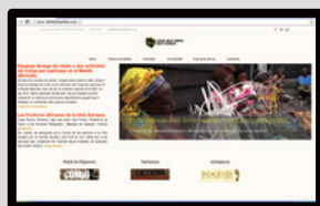
www.dretsdelpobles.org Pàgina corporativa de l'entitat

Els webs actius de la Lliga dels Drets dels Pobles durant el 2019 han estat: