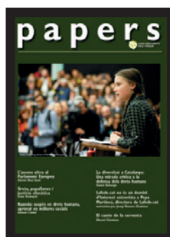
Número 71 (juny 2018)