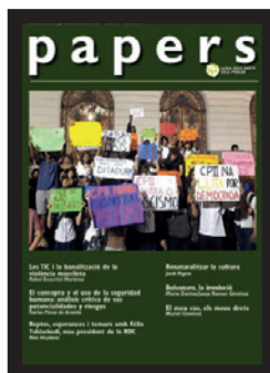
Número 70 (febrer 2019)

S’han publicat el número 70 (febrer 2019), en el qual destaquem “Les TIC i la banalització de la violència masclista” i “Bolsonaro, la involució”; el número 71 (juny 2018) on parlem de “L’ascens ultra al parlament europeu” i “Greta, papallones i justícia climàtica”, i el número 72 (novembre 2019), un monogràfic sobre l’Amazònia amb articles de les dones que van conviure a les Estades Solidàries amb les famílies de les comunitats del Parapapura i una entrevista amb el responsable del projecte de la Lliga, Jorge Vélez, un home sensible i força conegedor de la realitat amazònica.