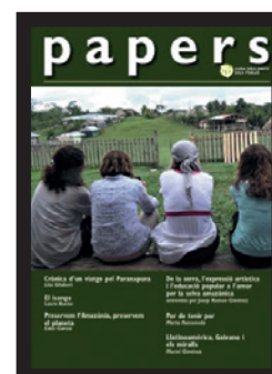
Número 72 (octubre 2019)