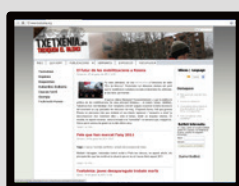
txetxenia.dretsdelpobles.org Pàgina de la campanya de Txetxènia